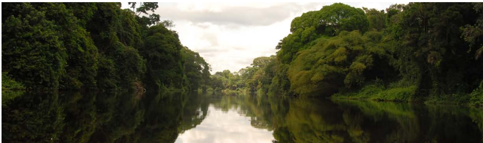
Crédit : Patrick Nyemeck Brown, AMFI Secretariat, Location: Dja et Mpomo Model Forest, Cameroon

Pour en savoir plus sur la préparation du plan stratégique, reportez-vous Cadre de travail pour la planification stratégique d'une Forêt Modèle .